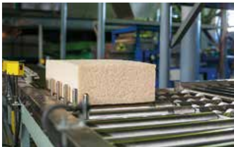
Продукция красноярского предприятия СИБУРА вошла в топ «100 лучших товаров России»

– Важно, что успешность предприятия зависит от качества. В этом направлении вы работаете и свои пока-