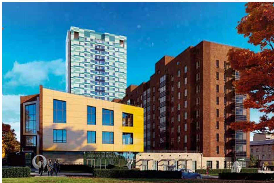
Проект художественных мастерских

Что необходимо сказать о проекте? Во-первых, он уникален концептуально. В проект органично встроены элементы исторической памяти Красноярска – жилой