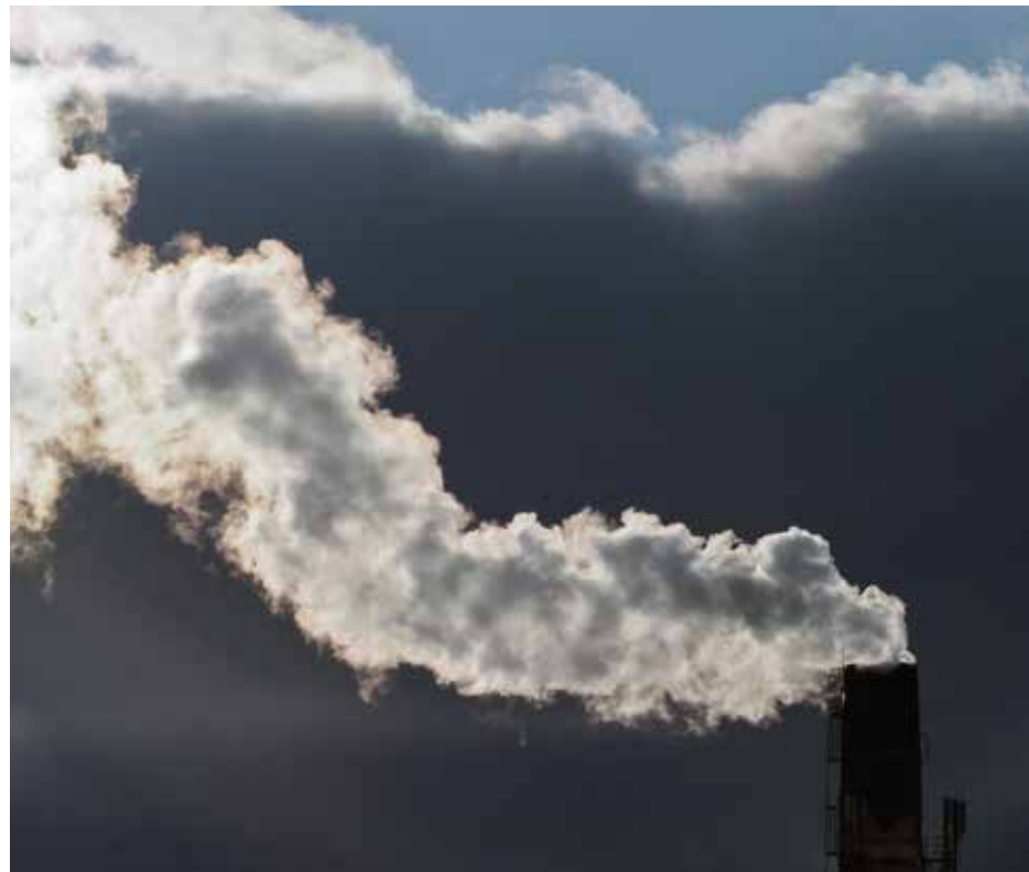
На красноярских предприятиях обещают ввести «зеленый» режим

Часовитин сообщил, что Красноярск одним из первых в стране начал массово регистрировать источники загрязнения, в том числе и мелкие. Казалось бы, оче-