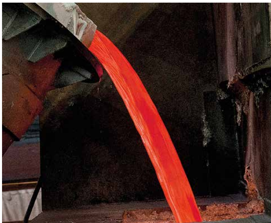
За счет модернизации действующих и запуска новых мощностей в ближайшие три года властями прогнозируется рост промышленного производства в крае на 7,6%, в том числе в сфере выпуска цветных металлов

В КрасЖД информируют, что «Разрез Майрыхский», один из разработчиков Бейского месторождения, уже обратился к железнодорожникам с заявкой, в которой указывает, что к 2025 году предприятие планирует нарастить объемы погрузки до 25 млн тонн в год. Это требует развития целого угольного кластера на базе разъезда Кирба – это Южный ход Междуреченск – Тайшет. Кстати, хакасское направление – это еще и железная руда. В частности, за счет того, что наращивает объемы Абазинский рудник, погрузка железной руды в этом году на 42% боль-