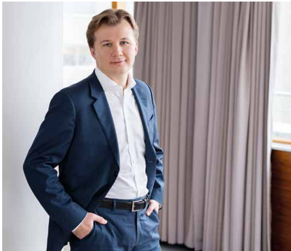
Председатель правления Росбанка Илья Поляков

– Безусловно, рост кредитования – как в розничном, так и в корпоративном сегменте. Сберегательная модель населения окончательно сменилась на модель потребления, розничное кредитование за 10 месяцев 2018 года выросло в целом по рынку почти на 19%. Самыми быстрорастущими сегментами стали необеспеченные потребительские кредиты и ипотека, поддерживаемая исторически низкими ставками и госу-