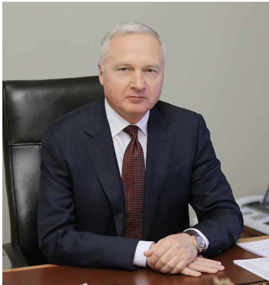
Председатель правительства Красноярского края Юрий Лапшин

— «Енисейская Сибирь» — комплексный инвестиционный проект в том смысле, что у него разное наполнение с разной глубиной проработки, разной инвестиционной емкостью и разными режимами государственной поддержки. Например, «Технологическая долина», проект группы «РУСАЛ», — особая экономическая зона, а «Южный кластер» «Норильского никеля» — региональный инвестиционный проект, другой спецрежим. Помимо этого, федеральным законодатель-