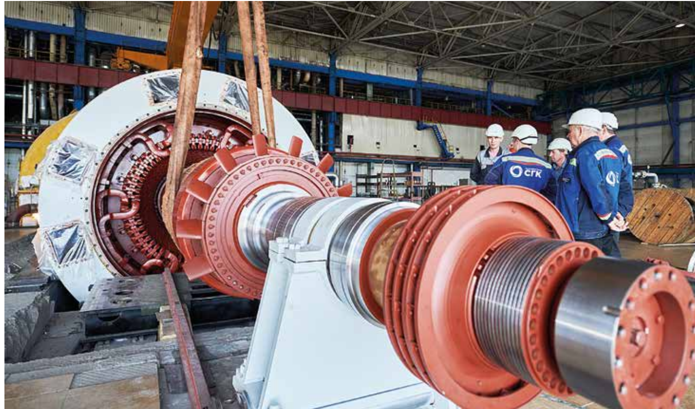
В 2018 году на Красноярской ТЭЦ-3 заработал новый генератор. Его сборка — ювелирная работа, при установке ротор не должен касаться обмотки статора