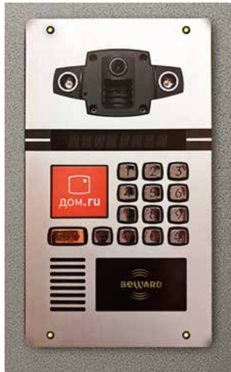
Умный домофон позволяет клиенту полностью управлять домофонной панелью с помощью мобильного приложения

— Панели позволяют осуществлять комплексный мониторинг придомовой территории. Данные с камер могут быть использованы как коммунальными службами, так и управляющими компаниями для контроля содержания придомовой территории, например вывоза мусора, снега, и правоохранительными органами для обеспечения общественного порядка, анти-террористических мер, расследования преступлений. Только представьте, благодаря нашему техническому решению не потребуется совершать обход квартир с целью опроса свидетелей, достаточно будет снять показания видеокамеры, размещенной на подъезде. Кроме того, возможна и интеграция панелей с городскими системами для оперативного оповещения жителей в случае чрезвычайных ситуаций, а также локальных происшествий, к примеру аварии теплоснабжения. Единый программный комплекс подъездов, калиток, шлагбаумов позволяет открывать двери и т. д. удаленно через приложение, что особенно важно для экстренных служб. Безусловно, мы настроены на активное развитие этого продукта. Мы уже видим мотивированный интерес к новой технологии со стороны жителей и уверены, что с повышением массового знания о продукте этот интерес будет только усиливаться.